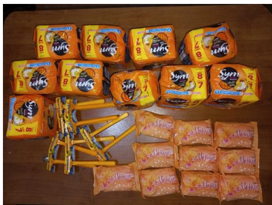
Figura 3: Entrega das Doações no Pronto Socorro Psiquiátrico Wassily Chuc