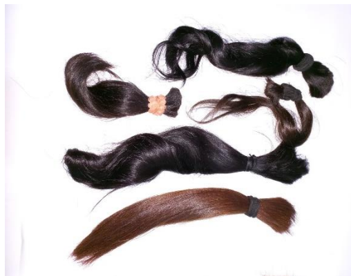
Figura 7: Doações entregues para produção de perucas para mulheres de baixa renda que se encontram em tratamento oncológico.