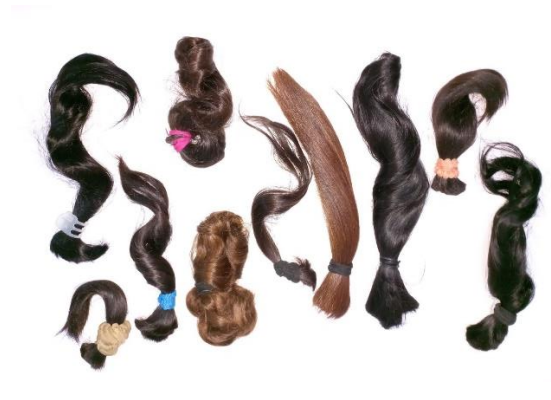
Figura 8: Doações entregues para produção de perucas para mulheres de baixa renda que se encontram em tratamento oncológico.