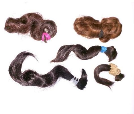
Figura 6: Doações entregues para produção de perucas para mulheres de baixa renda que se encontram em tratamento oncológico.