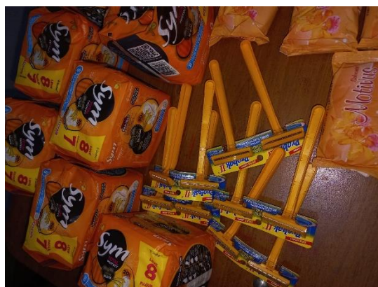
Figura 2: Entrega das Doações no Pronto Socorro Psiquiátrico Wassily Chuc