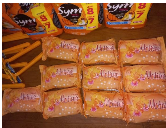
Figura 4: Entrega das Doações no Pronto Socorro Psiquiátrico Wassily Chuc